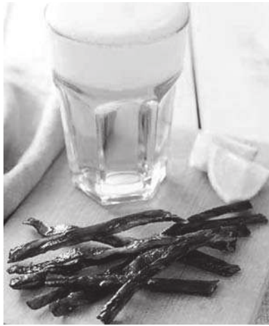
㊧ビールのお供に最適な かっぱのジャークースティック