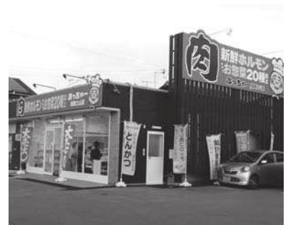
姫路土山店外観 「惣菜20種類以上」が目立つ

対応できる配達販売など独自の強みで一〇〇周年を目指します。 ○配達販売とは 縁あって保育園に日用品等を配達していたのですが、それを知ったお客様から「是非ウチにも寄って欲しい」との声がありました。買物難民と呼ばれる方が増えつつある中、スタッフとも話し合い