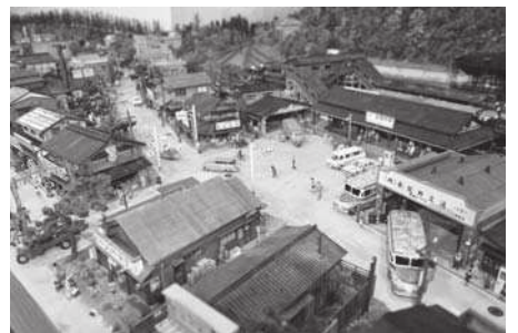
本物と見間違うほど精巧な街並み

の一つですが、それ以上に全国各地に多くの愛好家がいるため、観光客を呼び込むうえでも最適と考えたからです。事実オープンしてから半年ほど経ちますがお客様の九割超は市外の方で、海外のお客様も時折来られます。 また当館は文政元年（一八一八年）に建設された築二〇〇年の私の生家を改修しており、建物自体