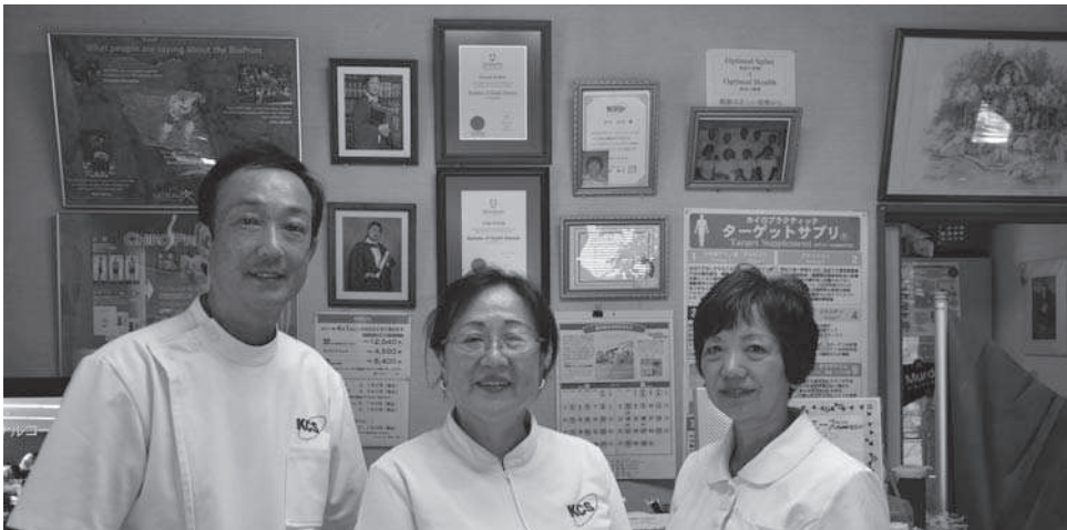
代表の岸田氏（中央）。背後には州立マードック大学の学位記が飾られている。