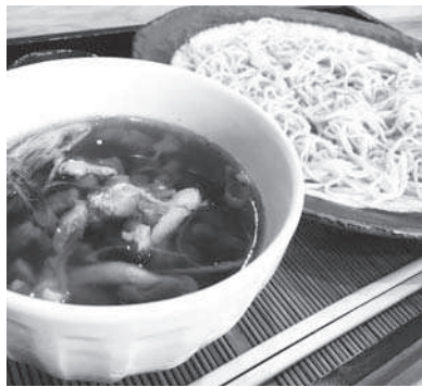
オリジナルメニュー ひねどりつけそば (1,150円)

また、ご飯物もご用意していますので、蕎麦だけでは食べ足りないと感じる方もご安心ください。夜はおでんをはじめ、お刺身、焼き魚、自慢の一品料理など多様な酒の肴を取り揃えています。勿