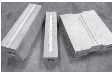
兵庫新商品認定 “ムーンブロック”

公共工事等の大きな施工依頼だけに限らず、個人の方からのお問合せも承っておりますのでお気軽にお問い合わせ下さい。