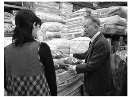
お客様に納得の一品を提供いたします

ニが発生しにくく、保湿性・速乾性に優れたホロフィルという素材が使われた寝具をお勧めしています。手入れも簡単でご家庭でも丸洗いが可能です。 羽毛ふとんを大切に長く使いたいと思われ方のために、古くなつたふとんを新品同様にふかふかに生まれ変わらせるリフォームを行っています。リフォームは購入から五〜十年が目安といわれており、中の羽毛を取り出して洗浄・補充を行ない、ご希望があればサイズの変更もできます。 また、一年を通じて古い布団の綿わたにポリエステル製のわたを二パーセント程度混ぜることで布団の弾力性を上げ、軽量化・防ダニ加工を施す布団打ち直しキ