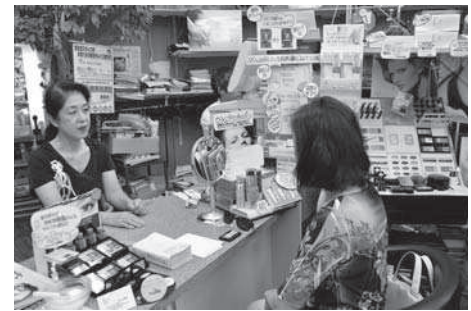
丁寧な受け答えで お客様にアドバイス

事前にご予約いただくとリンパマッサージもさせていただきます。追加料金はかかりませんがフェイスマスクもしており、お客様のご希望を伺い肌の状態に合ったものをお勧めしています。マスクには美白・たるみの解消・毛穴のキメの整え・肌に潤いを与える等の効果があります。お気軽にご相談ください。当店は「地域のお客様を美しく元気に」という理念に基づいて美容の知識を提案しています。