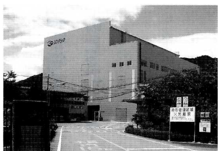
▲2010年の稼動に向け着々と準備が進む最新鋭の新工棟

〇の印刷会社へ納品している。ロット多品種に対応できる体制を整え、受注の約四割は即日出荷。食品・日用品・家電等に貼付する表示ラベル等に加工されている。今年二月、龍野工場では二酸化炭素(CO 2 )排出量削減のため、ボイラー燃料を灯油から天然ガス(LNG)へ転換した。マイナス一六三度に冷却し液化したLNGをタンクで貯蔵し気化して使用する設備を導入。年間約一〇〇〇トンの削減効果が見込まれている。