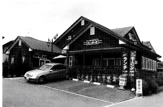
▲道路沿いに建つブラウンの壁と モスグリーンの屋根が目印の店舗